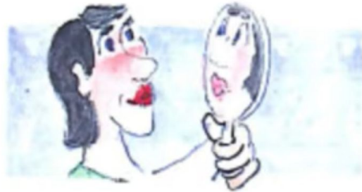
d. Sie schaut sich an.

She is looking at herself in the mirror ja. Sie schaut sich an. So er rasiert sich, sie schaut sich an.