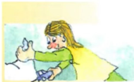
e. Es versteckt es.

She is looking at herself in the mirror ja. Sie schaut sich an. So er rasiert sich, sie schaut sich an.