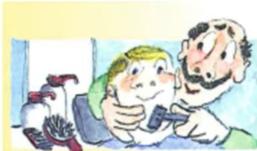
a. Er rasiert ihn.