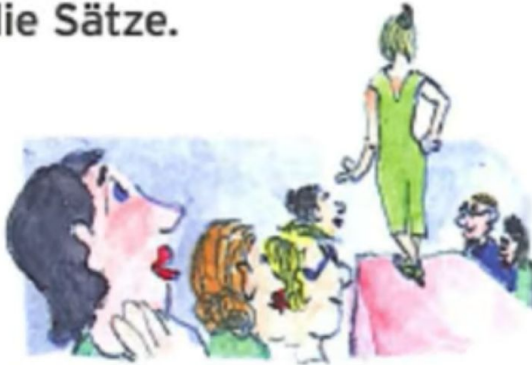
c. Sie schaut sie an.