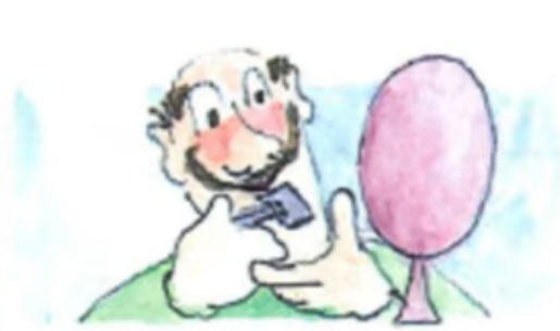
b. Er rasiert sich.

Rasieren. What is a razor? Razor is for shaving. Shaving, rasieren. Ich rasiere mich. Du rasierst dich. Er rasiert sich.