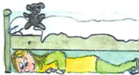
f. Es versteckt sich.

Okay. es versteckt es. Verstecken. What is the little girl doing? Hiding. Verstecken is to hide. Das Kind versteckt das Auto. Das kind versteckt das-. What is a toy? Puppe is a doll. Spielzeug ja. Ein Spielzeug. What is to play? Spielen. What is a Zeug? Any other word you know with Zeug? What is a Flugzeug?